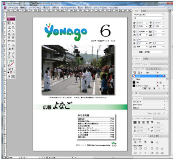
"広報よなご" を制作途中のInDesign CS3の画面。表紙の写真も足立氏が撮影したものを利用している。