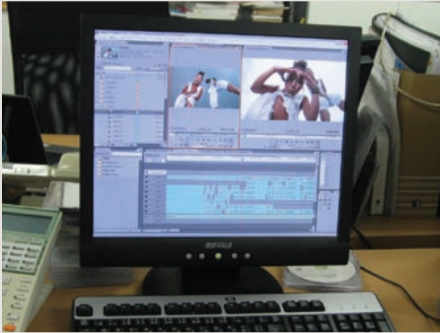
Premiere Pro の編集画面