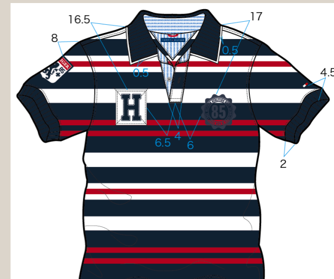
工場へ送られる指示書に添付されるデザイン画、詳細な数値が入力されている。

閑静な住宅街だった代官山に再開発計画が立ち上がったのは1990年代のことだった。同潤会アパートなどの歴史的な古い建物が撤去されると斬新な建造物とともにアパレルショップやレストランが立ち並ぶようになり、たちまちオシャレな街へと変貌した。