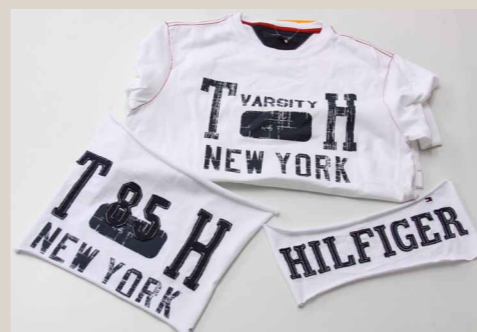
次期シーズン用にデザインされたTシャツと、ロゴのプロトタイプ。実際に布に印刷されたものと見比べて、最終的に判断する。