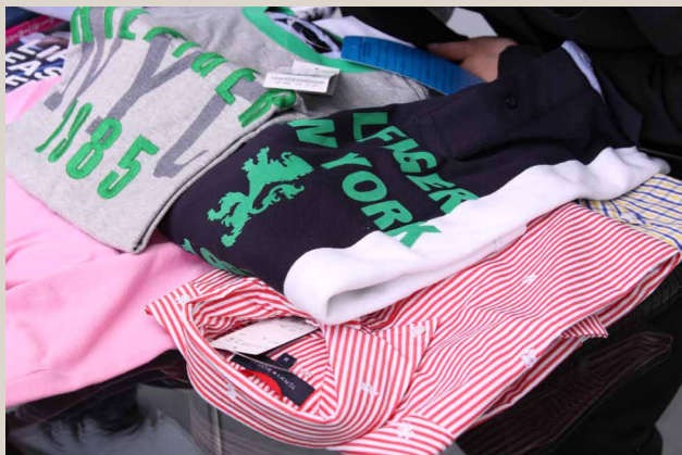
鈴木氏がこれまでにIllustratorを利用してデザインした服の数々。