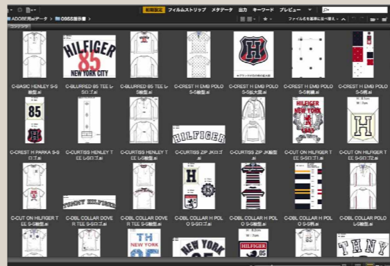
鈴木氏のパソコン内に収録された過去のデザインデータ。膨大なライブラリの中から目的のデザインを探したすのにAdobe Bridge®が役立っている。