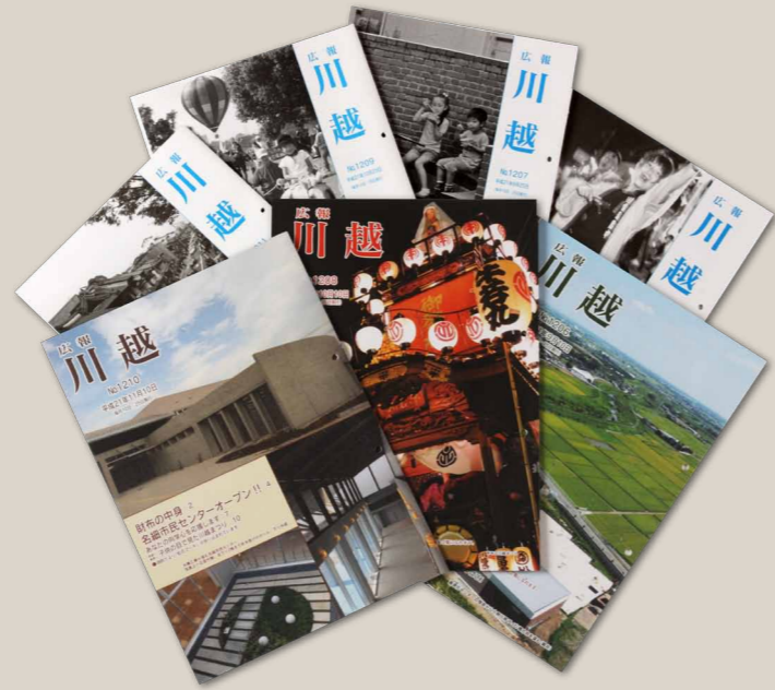
Adobe InDesign CS4を利用して制作された広報川越。月2回の発行で、4色カラー版と2色版が交互に発行されている