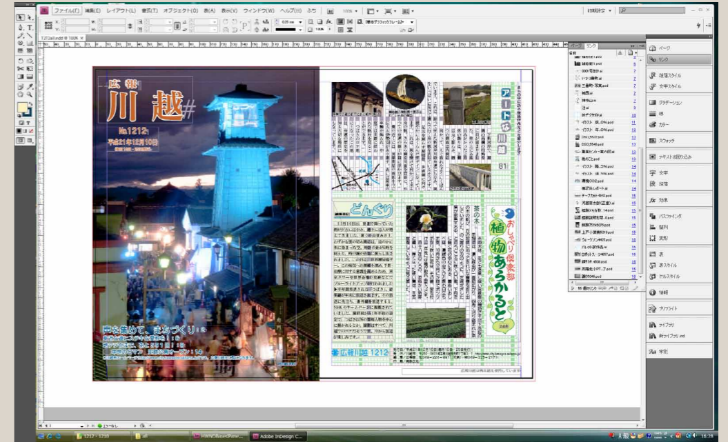
Windows Vista上で稼働するInDesign CS4。段落スタイルや表組の作成機能など、多くの機能が作業効率の向上に役立っているようだ

埼玉県川越市は、県の中央部のやや南部に位置し、34万人もの市民が生活する閑静な住宅街だ。近年は東京のベットタウンとして注目を浴びている川越だが、江戸時代には江戸の経済を支える物流の要所として重要な役割を担ってきた。江戸との縁が強く、その繋がりや反映ぶりから川越は“小江戸”とも呼ばれ、商人が行き交う賑やかなまちとして栄えてきた。今でも当時の面影を残す“蔵造り”の町並みが残されており、東京からわずか1時間ほどの立地条件の良さもあって、国内外から訪れる観光客でいつも賑わっている。そんな川越市の“現在”を伝える広報紙の制作現場でCreative Suite 4が活躍しているという。今回は川越市役所に訪問し、自治体が発行する広報紙の制作現場取材した。