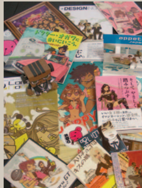
書籍の装丁からキャラクターデザインまで、 Baron氏が活動するフィールドは広い