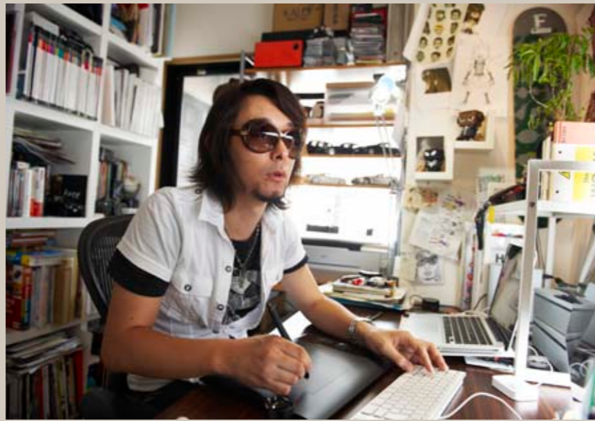
Baron氏の自宅兼作業場。これまでに描いたイラストや制作中のラフ画などがところせましと飾られている