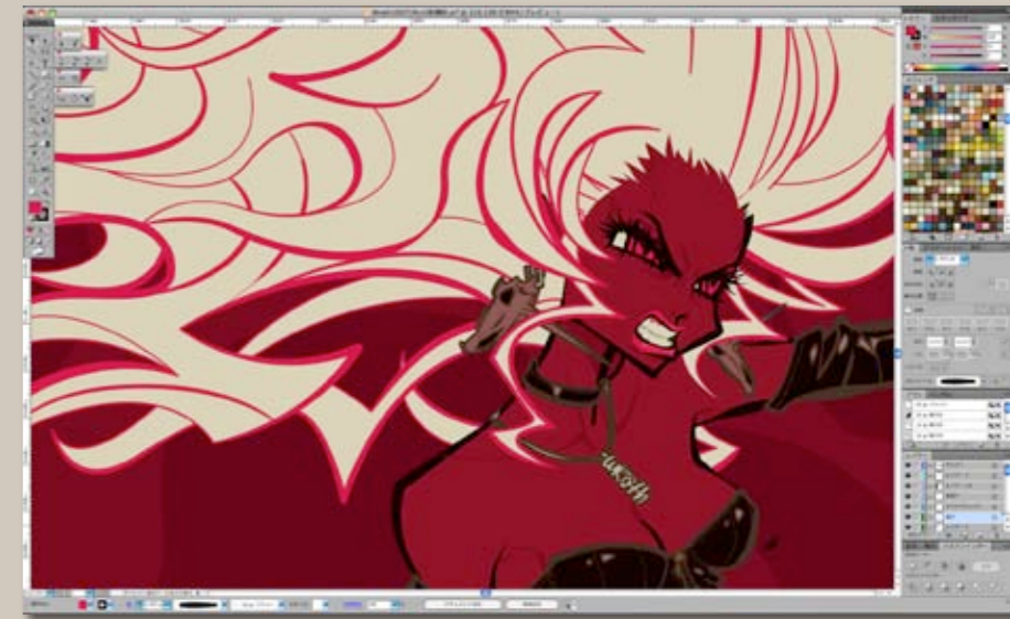
8月9日から始まる企画展“feu”用に書き起こしたオリジナルイラストレーション。企画展では、複数のアーティストが“火”をテーマとして作品を展示する予定だ。 Baron氏は、憤怒する女性を描くことで火の裏テーマとしている。 Illustrator CS5からサポートされた線幅ツールによって、これまで単一だったキャラクターのラインに強弱が含まれていることがわかる