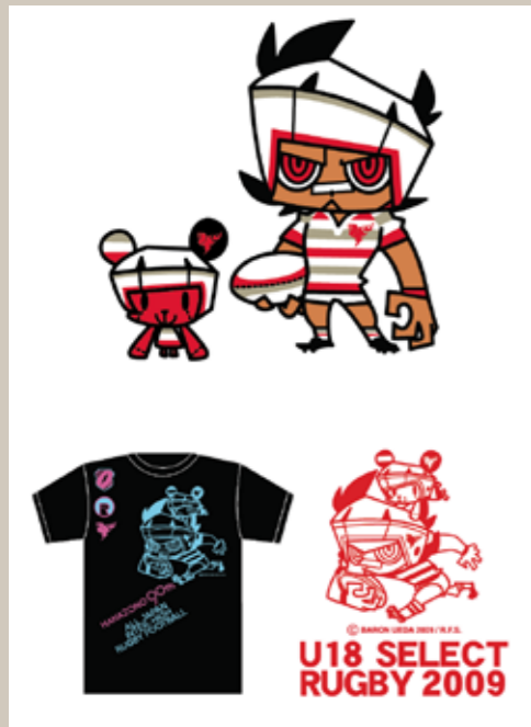
全国高等学校体育連盟ラグビー専門部の公式キャラクターデザインを担当している